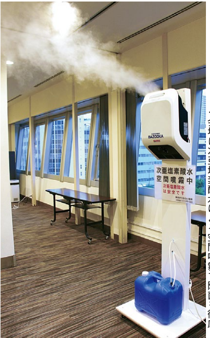
▲会場は次亜塩素酸水による空間噴霧で除菌を徹底して行われた